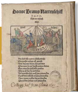
La Nef des Fous, de Sébastien Brant, 1494, premier best-seller européen

En 1998, l'Académie d'Alsace a fait son entrée à la Conférence Nationale des Académies, signe de reconnaissance envers le travail en profondeur mené depuis sa refondation. Elle s'est renommée Académie d'Alsace des Sciences, Lettres et Arts après son admission à la CNA.