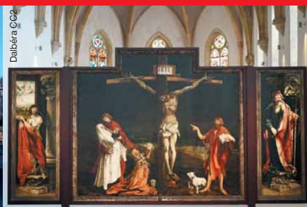
Le Retable d'Issenheim à Colmar